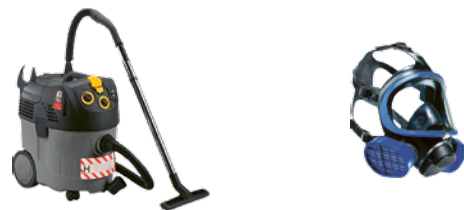
1: Beispiele von Arbeitsmitteln bei Asbestsanierungen

Wichtig: Ermitteln Sie mögliche Gefahren, die bei der Reinigung von asbestkontaminierten Arbeitsmitteln auftreten, noch vor Arbeitsbeginn.