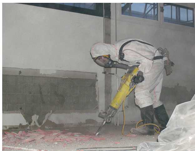
2 Ein Bodenbelag wird mit einem Spitzhammer entfernt.