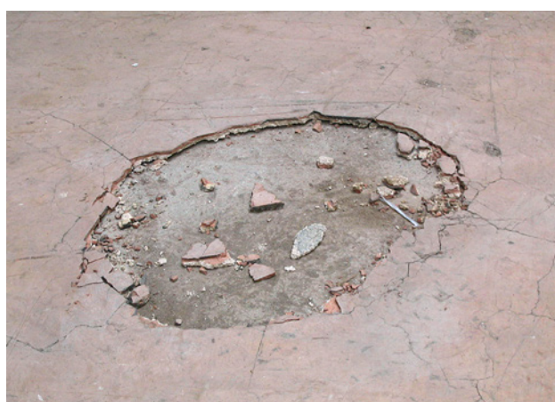
1 Steinholz-Bodenbelag – asbesthaltiger Magnesia-Estrich

Besteht der Verdacht, dass beim Bearbeiten oder Entfernen von Steinholzbodenbelägen Asbest auftreten kann, so sind die Gefährdungen vor Beginn der Arbeiten genau zu ermitteln.