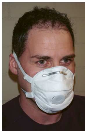
2 Einwegstaubmaske FFP3