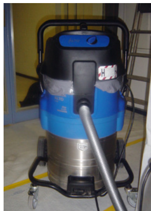
3 Industriestaubsauger mit Filter für Staubklasse H (Asbest)