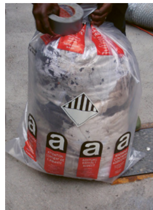
4 Kunststoffsack mit der Kennzeichnung Asbest