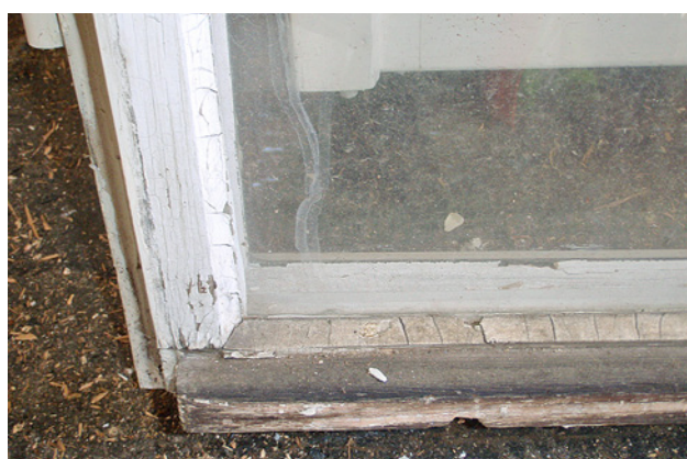
1 Asbesthaltiger Leinölkitt an einem Holzfenster

Besteht der Verdacht, dass beim Neuverglasen oder Rückbau von Fenstern Asbest auftreten kann, müssen die Gefährdungen vor Beginn der Arbeiten genau ermittelt werden.