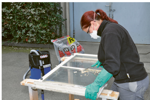
2 Entfernen von asbesthaltigem Fensterkitt mit Stechbeitel oder Spachtel